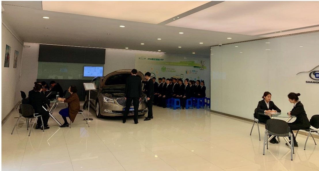
学生在汽车营销实训室（模拟 4S 店展厅）进行课程实训

和 1 个汽车驾驶训练场，与上汽通用汽车合作建有国内一流的 ASEP 示范教学中心。配套齐全，设备先进，功能完善。