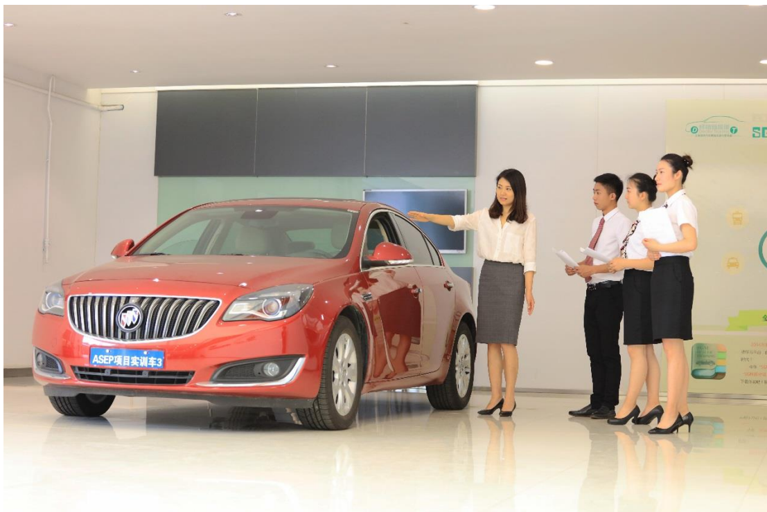
专业课教师为学生授课