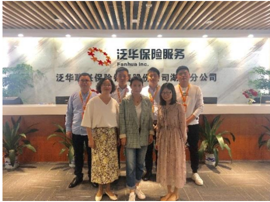
教师赴泛华保险慰问毕业生