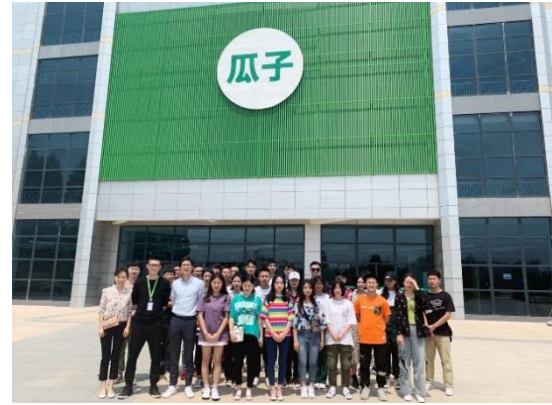
学生在瓜子二手车进行课程实训