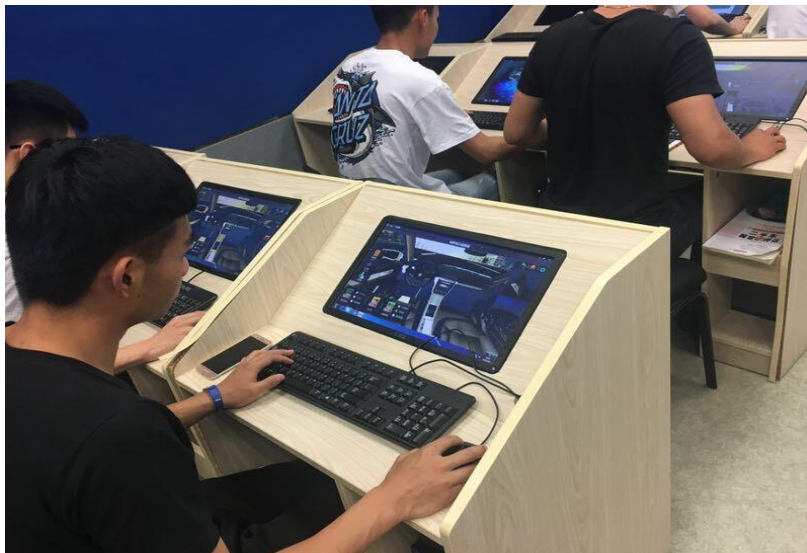
学生使用二手车鉴定评估仿真软件进行仿真学习